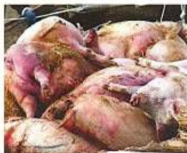
Гибель свиней при заражении АЧС до 100%!

ВНИМАНИЕ!!! Средства для профилактики и лечения болезни НЕ СУЩЕСТВУЕТ!